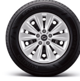
16" 스틸 휠