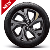
18" 다이나믹 블랙 투톤 딥터드 골드 액센트 알로이 휠