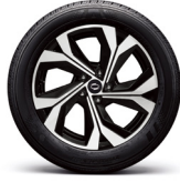
18" 다이나믹 블랙 투톤 알로이 휠