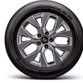
17" 다크 그레이 휠