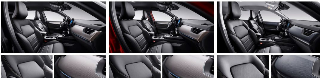
블랙 가죽시트 (RE, INSPIRE 선택) 하이드로 핵사곤 데코 (RE, INSPIRE) 블랙 헤드라이너 & 골드 스티치 (RE, INSPIRE)