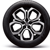
18" 블랙 투톤 알로이 휠