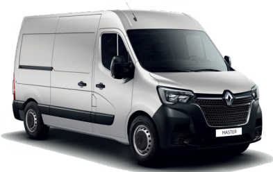
실버 그레이 Silver Gray