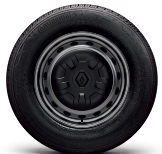
16" 스틸휠 & 휠커버 225/65R16 타이어(콘티넨탈)