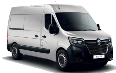
실버 그레이 Silver Gray