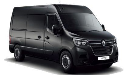
메탈릭 블랙 Metallic Black